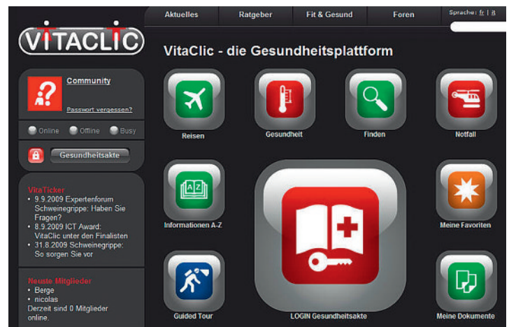
Abbildung 1 Screenshot VitaClic.ch.

VitaClic.ch heute weiter. VitaClic ist eine Neuentwicklung, die von der Online Easy AG – unabhängig von der KPT und offen für alle – betrieben wird. VitaClic kann dank der Sharepoint-Software vom gesamten Gesundheitssystem genutzt werden. VitaClic ist also nichts Proprietäres, sondern steht allen zur Verfügung (Abb. 1). Die persönliche Gesundheitsakte bildet heute das Kernstück von VitaClic.ch und gleichzeitig den Hauptnutzen für die Patienten. Sie bietet weltweit den sofortigen Zugriff auf persönliche Notfalldaten, wie z.B. den elektronischen Impfausweis, den Medikamentenpass, die Patientenverfügung und andere wichtige Dokumente. Diese Angaben können im Ernstfall Leben retten: VitaClic-Nutzer tragen zu diesem Zweck eine persönliche Notfallkarte mit Zugangsdaten auf sich. So können Nothelfer über das unabhängige Schweizer Zentrum für Telemedizin Med-