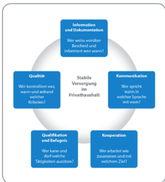
Abb.1: Poster, Link Grossansicht

Aus der Analyse wurden fünf Kernthemen abgeleitet, die für eine stabile Versorgung entscheidend sind, allerdings je nach Situation auf vielfältige und unterschiedliche Weise miteinander verschränkt sein können. Diese Kernthemen sind: Kommunikation, Kooperation, Qualifikation und Befugnis, Qualität, Information und Dokumentation. Sie bilden die Struktur für das Poster und werden durch Leitfragen präzisiert (siehe Abbildung 1).